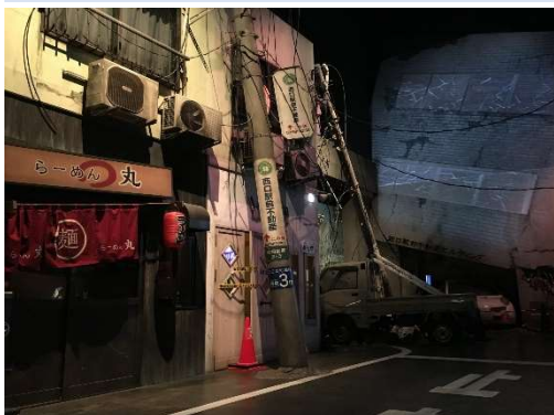
そなエリア災害体験コーナー

※小学生以上の方対象のツアーです。 ※未成年者の方は保護者の方同伴でお願いいたします。