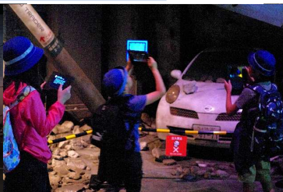
そなエリア災害体験コーナー