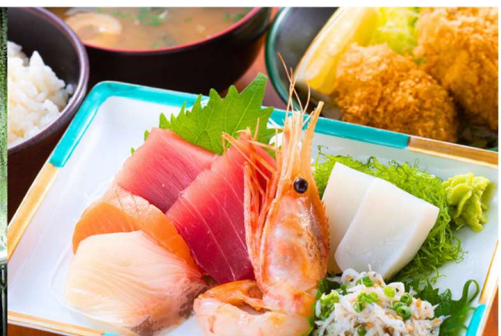
浜っ子食堂(ランチイメージ)