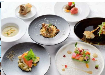
アマルフィレストラン